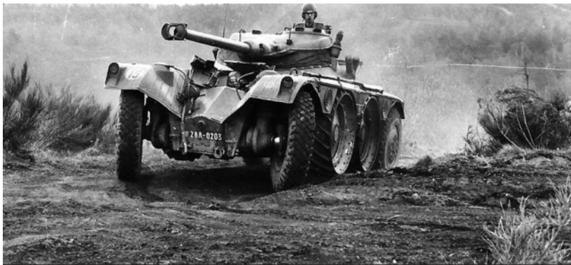
E.B.R Panhard, canon de 75mm, ayant équipés les 3ème Chasseurs d'Afrique , 12ème Chasseurs à Sedan ect....

Les 1er et 7ème régiments firent partie de l'Armée d'Armistice. Ils tinrent garnison à Vienne et à Nîmes où ils furent dissous en novembre 1942. Il faudra attendre la libération pour voir réapparaître les Chasseurs à cheval.