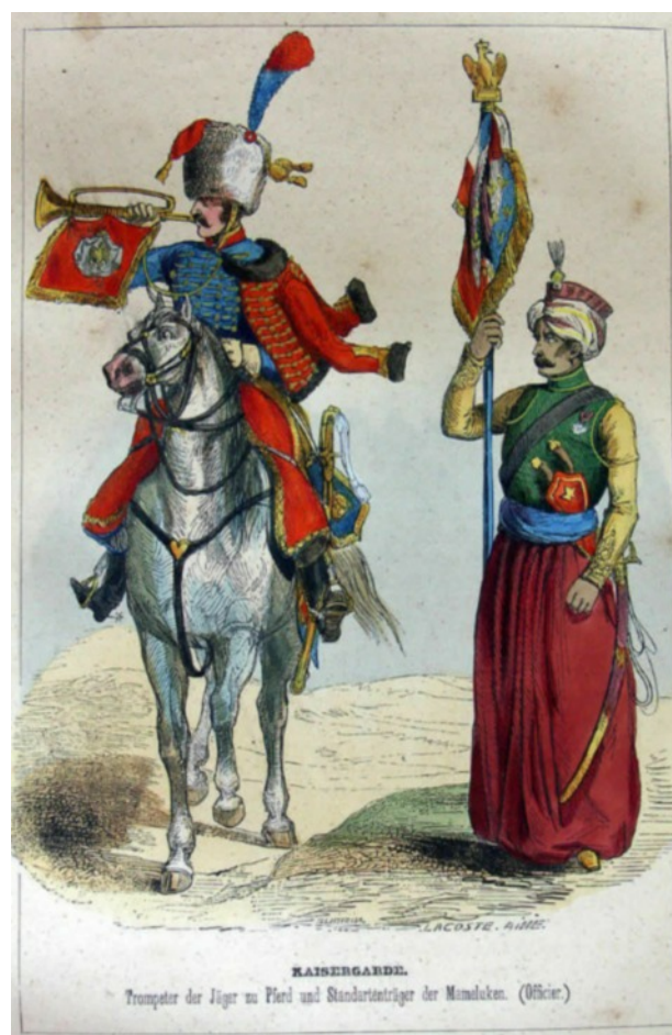
KAISERGARDE. Trompeter der Jäger zu Pferd und Standartenträger der Mamluken. (Officier.)