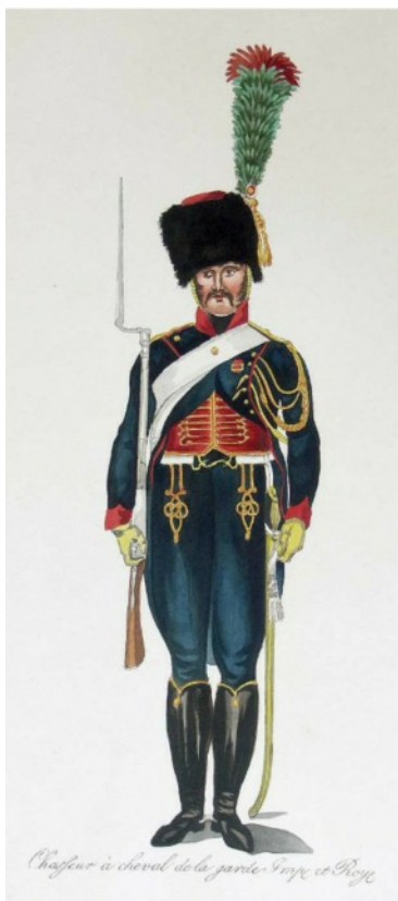
Planche n° 6 des frères HENSCHEL, chasseur à cheval de la garde Impériale et Royale de l'armée française, peint en 1810