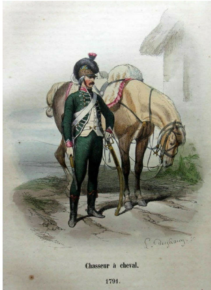
Chasseur à cheval.